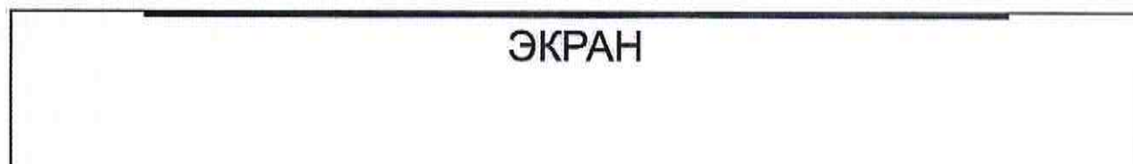
СХЕМА ЗРИТЕЛЬНОГО ЗАЛА КИНОТЕАТРА «СПЕЦИАЛИЗИРОВАННЫЙ ДЕТСКИЙ КИНОТЕАТР «МЕЧТА»