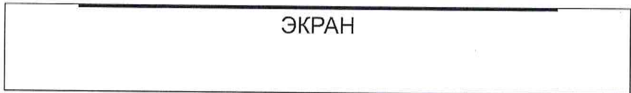
СХЕМА ЗРИТЕЛЬНОГО ЗАЛА КИНОТЕАТРА «СПЕЦИАЛИЗИРОВАННЫЙ ДЕТСКИЙ КИНОТЕАТР «МЕЧТА»